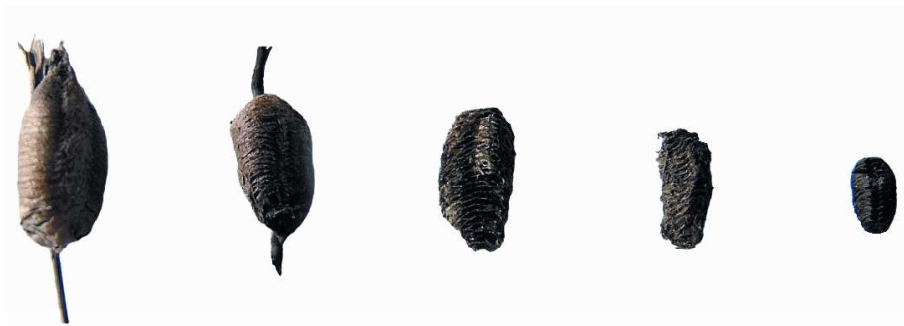
Abb. 2: Altersklassen der Ootheken von Mantis religiosa . Zunahme des Oothekenalters von links nach rechts. Fundorte: Kaiserstuhl (BW).

Anhand von Brandspuren konnten einige Eigelege exakt datiert werden. Voraussetzung war die Kenntnis des Brandzeitpunktes der Böschungsabschnitte, auf denen verbrannte Ootheken gefunden wurden. Diese Ootheken dienten als Referenz bei der Klasseneinteilung und erlaubten eine Zuordnung des Ablagejahres.